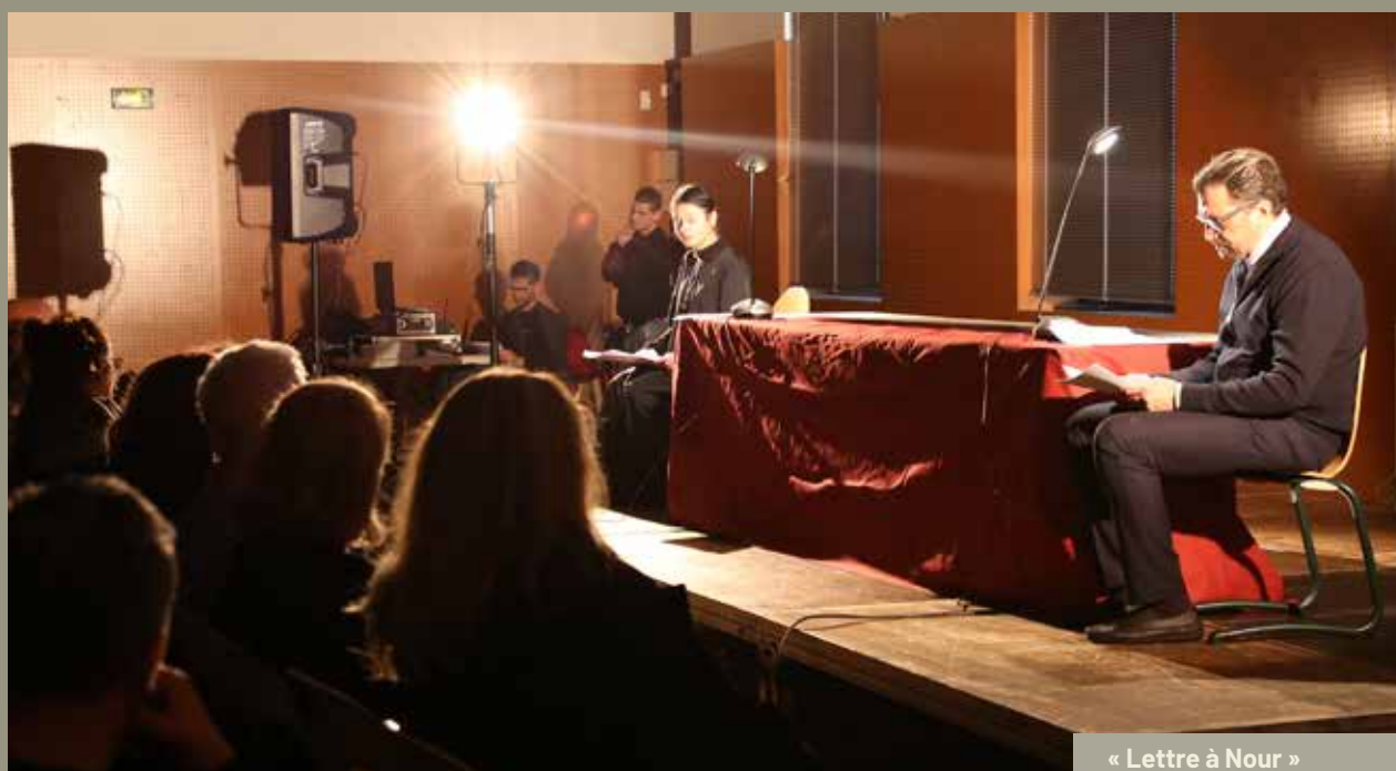
« Lettre à Nour »

• Prévention de la radicalisation : Le CLSPD a misé sur la culture et le débat pour aborder le sujet sensible de la radicalisation, en particulier religieuse, auprès du grand public. Deux pièces de théâtre percutantes ont été présentées à Villiers. « Lettre à Nour », monologue épistolaire poignant d'un père dont la fille est partie faire le djihad, a été jouée en partenariat avec le SPIP 94, devant 250 personnes profondément touchées. Ensuite, la pièce « Les Teneurs », axée sur les mécanismes d'embrigadement et financée par le Fonds interministériel de prévention de la délinquance (FIPD), a rassemblé un public de 450 personnes. Ces représentations théâtrales, suivies de débats, ont permis de délivrer un message de prévention sans stigmatiser, en soulignant le rôle de la famille et de l'esprit critique pour résister aux discours extrémistes. L'affluence importante démontre l'intérêt des habitants pour ces initiatives et la réussite de la Ville à traiter de sujets complexes via des supports innovants.