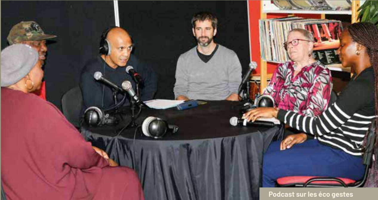
Podcast sur les éco gestes

• Parcours d'insertion innovant (éco-gestes) : Le CLSPD de Villiers a mis en œuvre un parcours d'insertion pilote axé sur le développement durable, une première dans le Val-de-Marne. Dès 2023, en partenariat avec l'association villiéraine DPF, un chantier d'insertion de 12 mois a été proposé à 10 jeunes (profils divers : étudiants, tigestes, semi-liberté, contrôle judiciaire), à raison de 24h par semaine [6] . Ce programme sur mesure vise à les former aux écocgestes et à la maîtrise de l'énergie, avec des activités quotidiennes et une action de médiation chaque vendredi auprès des habitants du quartier prioritaire des Hautes-Noues [7] . Au total, 880 heures de formation ont été dispensées, incluant des ateliers de développement personnel, d'insertion professionnelle et de sensibilisation environnementale. Le projet a connu un retentissement médiatique notable : il a été valorisé lors de la « Fabrique du TIG » départementale (atelier regroupant acteurs de terrain, personnel pénitentiaire, juge d'application des peines et vice-procureur), cité dans la presse locale (Actu94, Journal Spécial des Sociétés, Le Parisien ), et même présenté devant deux inspectrices du Ministère de la Justice dans le cadre d'une audition pour le Garde des Sceaux. Un livre intitulé « Noues et l'énergie » , auquel ont contribué la Présidente du tribunal et une Juge de Créteil, a restitué cette expérience (300 exemplaires imprimés).