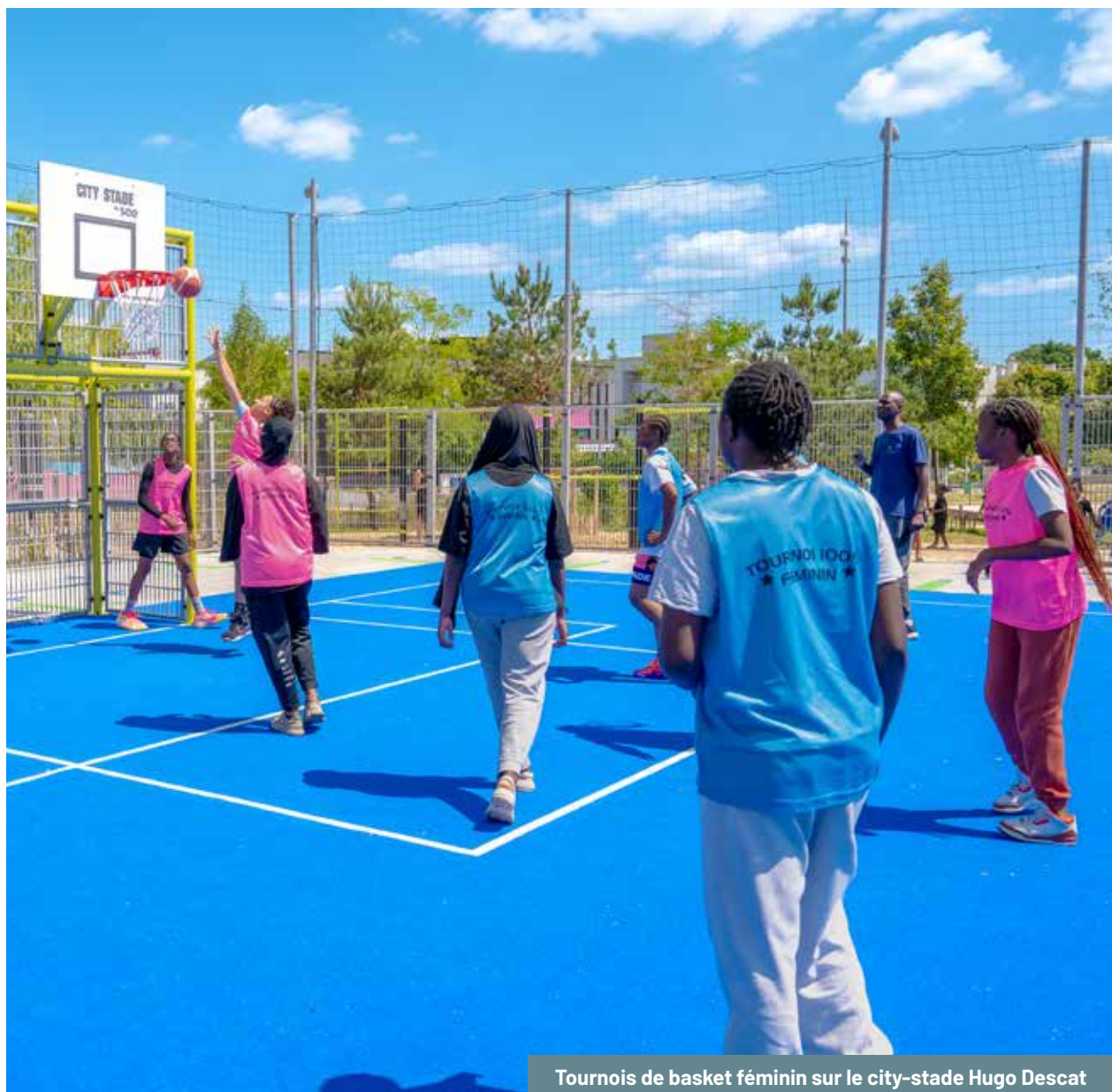
Tournois de basket féminin sur le city-stade Hugo Descat

• Médiation auprès du public féminin : Constatant que les filles et jeunes femmes des quartiers n'occupaient que peu l'espace public et les équipements sportifs (phénomène d'auto-exclusion ou de pression sociale), la Ville a développé des activités spécifiques pour le public féminin afin de favoriser leur épanouissement. Une salle de sport en accès réservé a accueilli une quinzaine de filles qui, entre elles, ont pu pratiquer librement fitness et cardio-training, loin du regard des garçons, ce qui a levé de nombreuses inhibitions. Par ailleurs, une activité basket hebdomadaire sur le city-stade Hugo-Descat rassemble désormais 40 jeunes filles , encadrées par des éducatrices, pour leur permettre de profiter de l'espace sportif public en toute confiance. Des ateliers de bien-être et confiance en soi ont aussi été proposés à une vingtaine de participantes, abordant des thèmes comme l'image de soi, la gestion des émotions ou la défense contre le sexisme ordinaire. Enfin, en lien avec les associations spécialisées, une séance de sensibilisation a été menée sur le phénomène du michetonnage (forme insidieuse de prostitution des mineures via les « petits amis » offrant des cadeaux en échange de faveurs) afin d'ouvrir les yeux des adolescentes sur ces situations de prédation. En libérant la parole et en créant des espaces sécurisés pour les filles, Villiers promeut l'égalité d'accès à la ville et prévient les violences de genre.