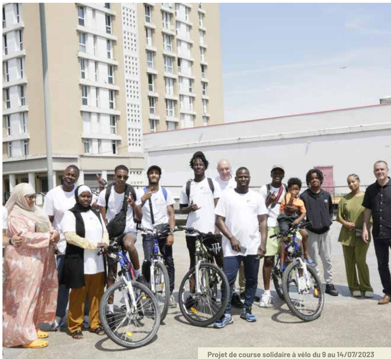
Projet de course solidaire à vélo du 9 au 14/07/2023