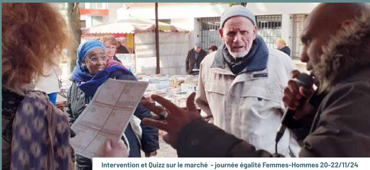
Intervention et Quizz sur le marché - journée égalité Femmes-Hommes 20-22/11/24