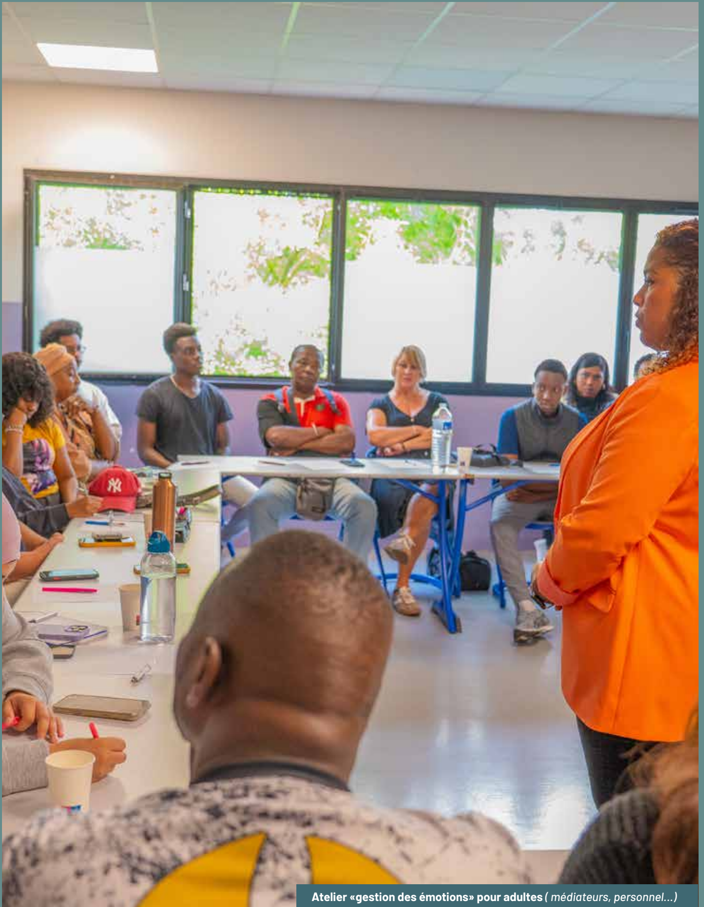
Atelier «gestion des émotions» pour adultes ( médiateurs, personnel...)