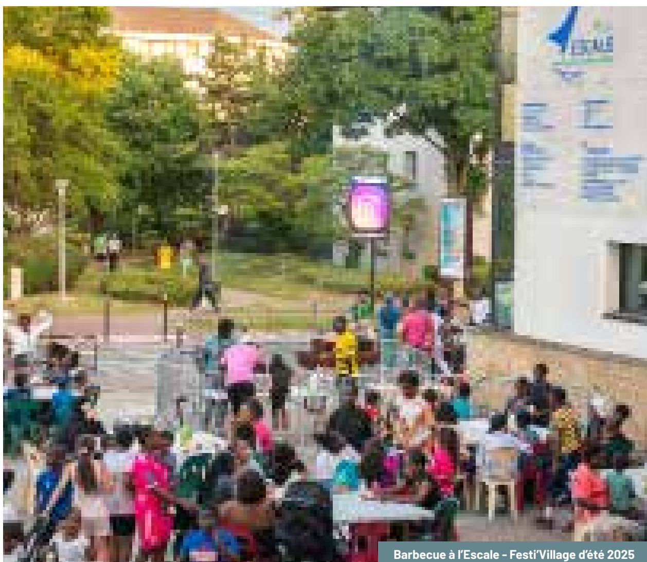
Barbecue à l'Escale - Festi'Village d'été 2025