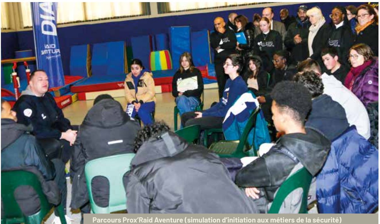
Parcours Prox'Raid Aventure (simulation d'initiation aux métiers de la sécurité)