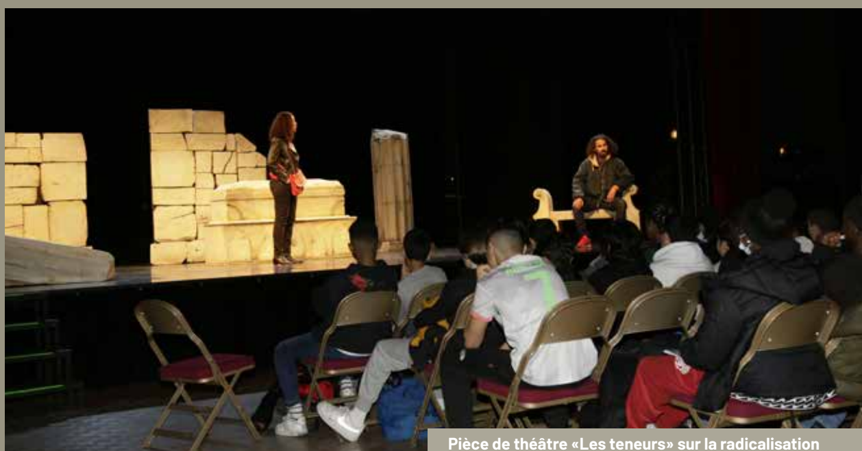
Pièce de théâtre «Les teneurs» sur la radicalisation