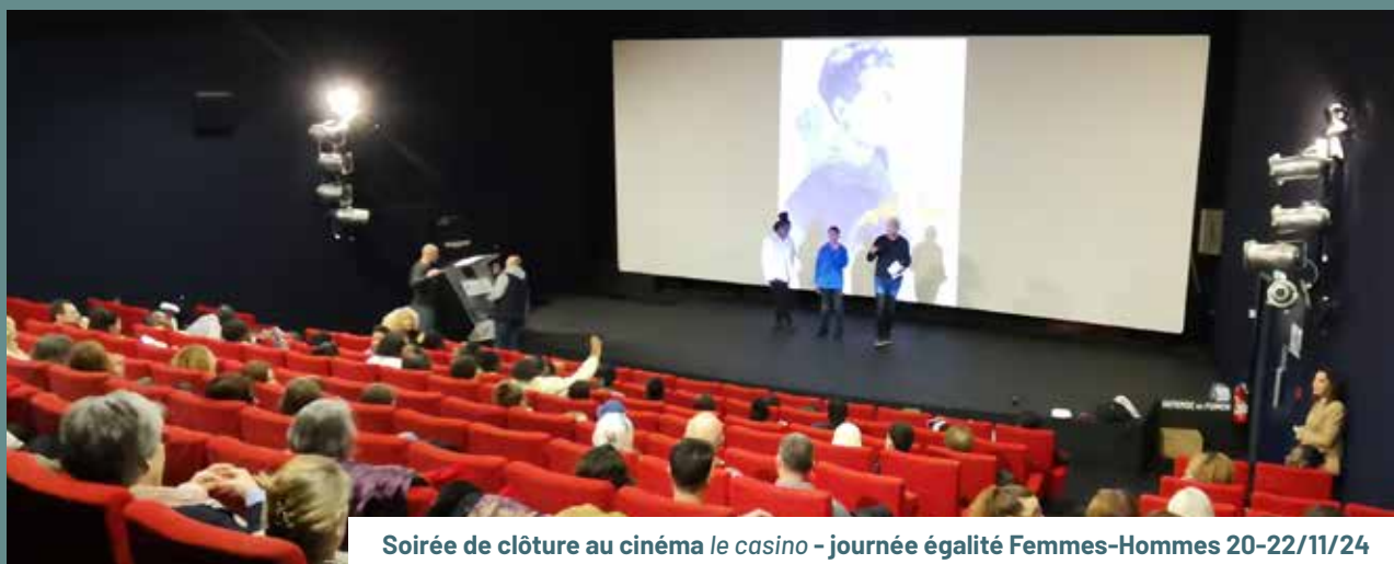
Soirée de clôture au cinéma le casino - journée égalité Femmes-Hommes 20-22/11/24