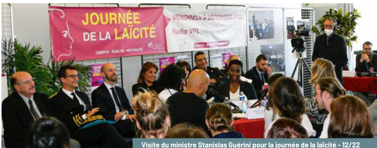
Visite du ministre Stanislas Guérini pour la journée de la laïcité - 12/22

Enfin, le CLSPD veille à favoriser le dialogue sur la laïcité avec tous les publics. Deux podcasts ont été enregistrés par la Ville : l'un, en public et en présence du ministre de la Fonction publique territoriale Stanislas Guérini et du Préfet délégué à l'égalité des chances, réunissait 100 personnes autour de témoignages d'agents sur la laïcité au travail ; l'autre a réuni 80 participants autour des représentants des différents cultes (évêque de Créteil, imam, rabbin...), démontrant que le vivre-ensemble et le respect mutuel se construisent dans l'échange. Par ailleurs, des espaces de discussion libres ont été mis en place pour les jeunes dans 8 structures municipales (maisons de quartier, service Jeunesse, centre de soins, médiathèque), permettant à environ 200 jeunes d'exprimer leurs questionnements sur les valeurs républicaines, la citoyenneté et la laïcité. L'ensemble de ces efforts contribue à ancrer fermement les valeurs de la République à Villiers-sur-Marne, tant au sein de l'administration que dans la population, et à prévenir les replis communautaires ou extrémistes par la pédagogie et la compréhension mutuelle.