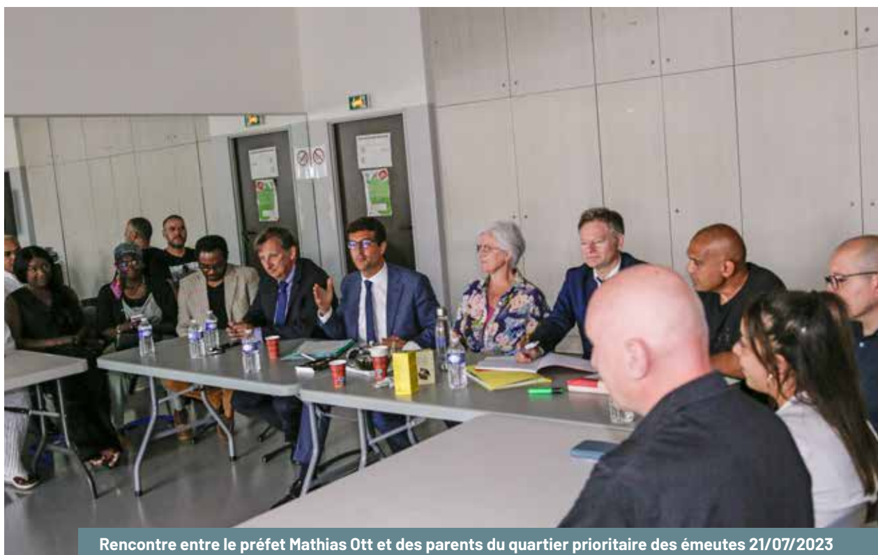
Rencontre entre le préfet Mathias Ott et des parents du quartier prioritaire des émeutes 21/07/2023