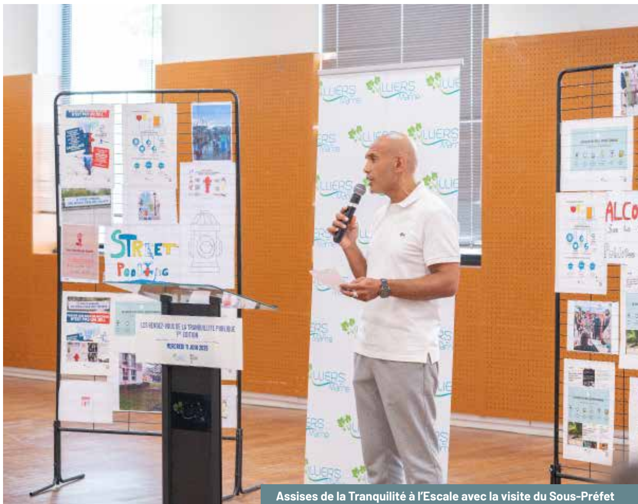
Assises de la Tranquillité à l'Escale avec la visite du Sous-Préfet