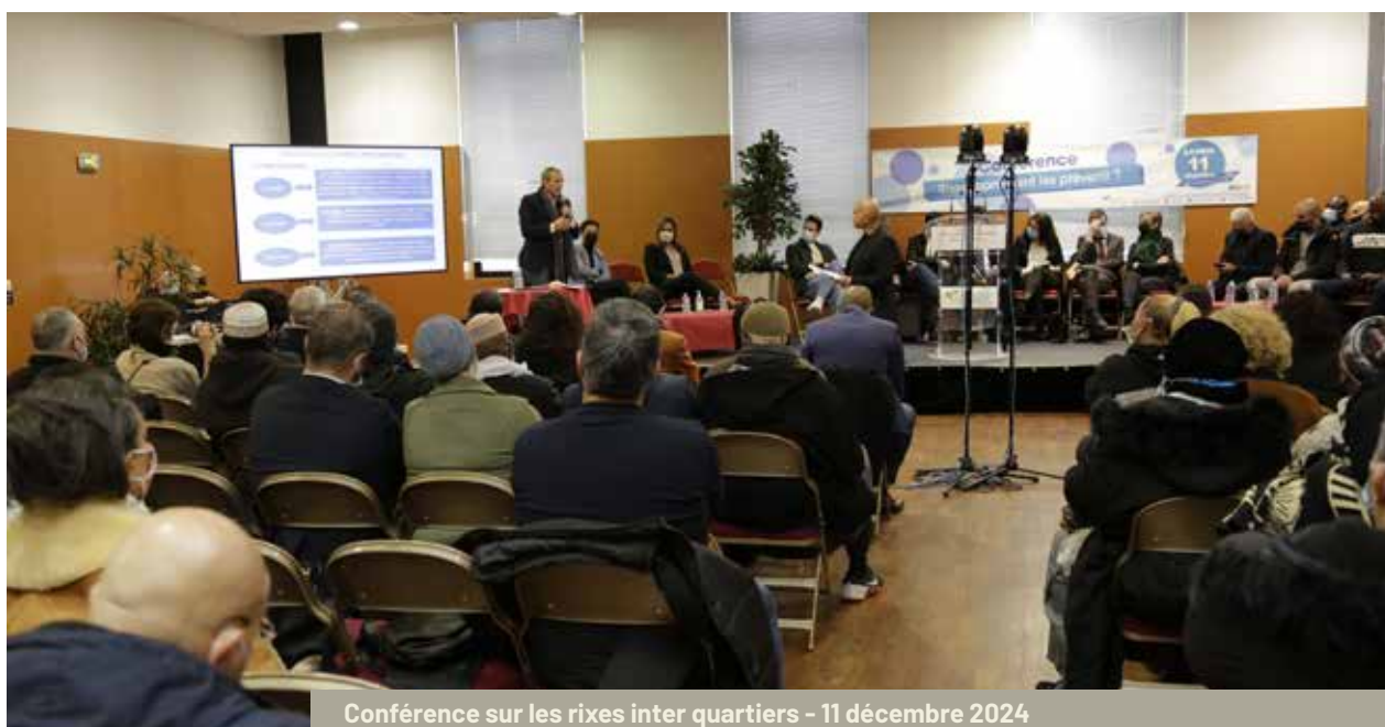
Conférence sur les rixes inter quartiers - 11 décembre 2024