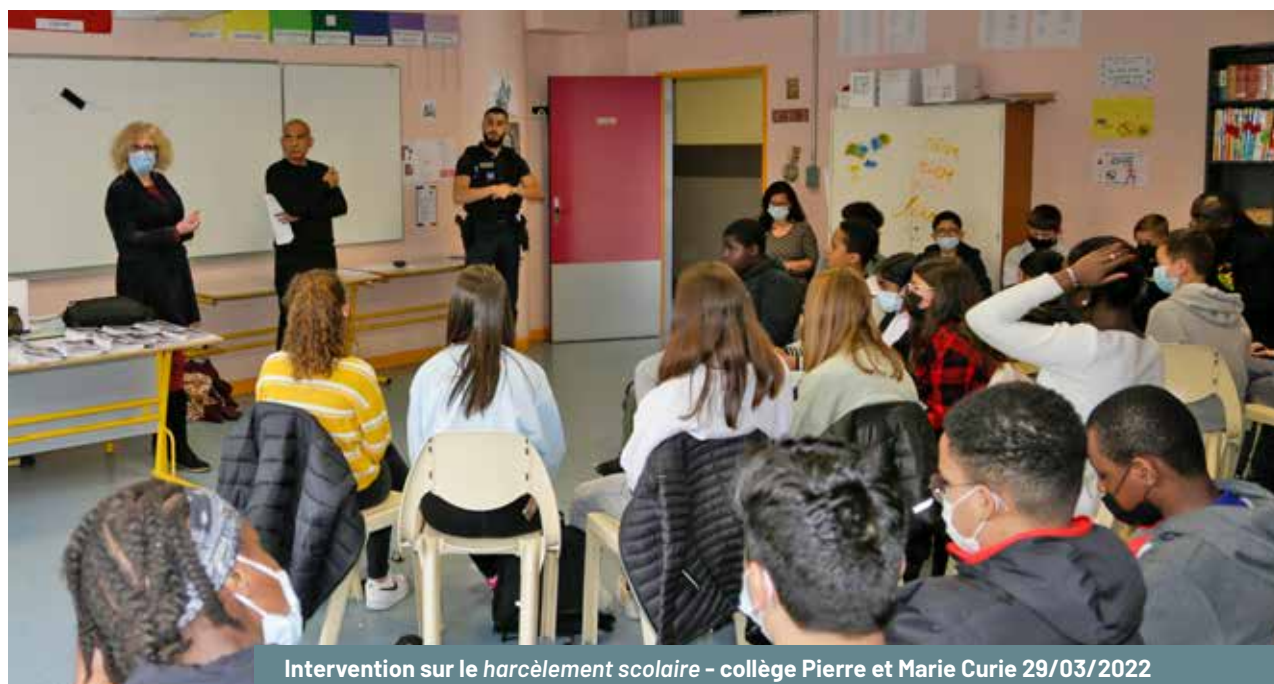
Intervention sur le harcèlement scolaire - collège Pierre et Marie Curie 29/03/2022