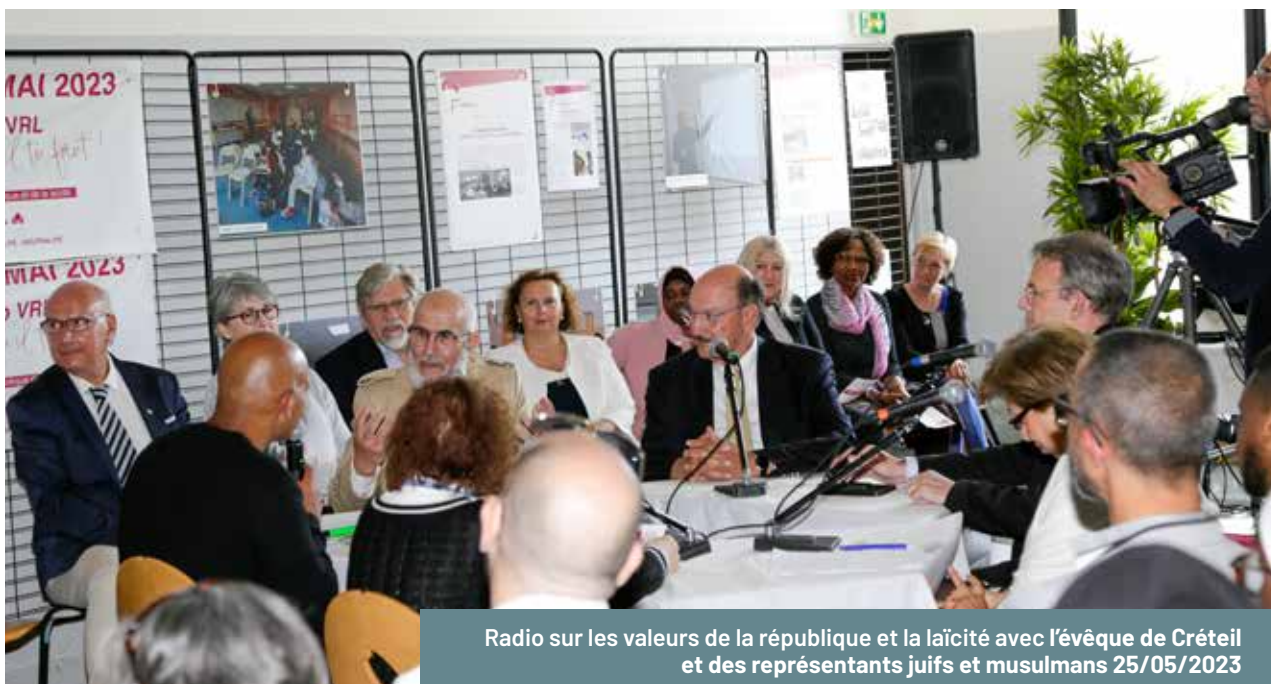
Radio sur les valeurs de la république et la laïcité avec l'évêque de Créteil et des représentants juifs et musulmans 25/05/2023

La Ville innove également en matière de supports pédagogiques VRL. Ses équipes ont créé divers outils ludiques pour intéresser les publics jeunes : un « Code de la laïcité » synthétique, une escape game thématique, un quiz type « Questions pour un champion » sur les valeurs républicaines, etc. Ces supports originaux sont partagés et valorisés auprès des autres communes via les réseaux de référents VRL, faisant de Villiers un exemple de bonne pratique au niveau départemental. En témoignage de ce rayonnement, le Préfet à l'Égalité des Chances a récemment apporté son soutien à un projet villiérais visant à étendre certaines de ces actions à l'échelle de tout le département, projet porté par une association locale qui a reçu la distinction nationale VRL.