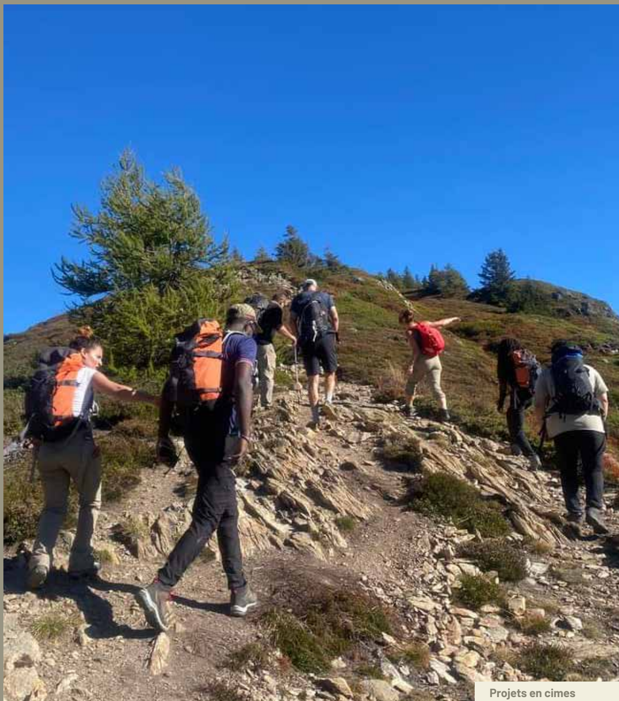
Projets en cimes