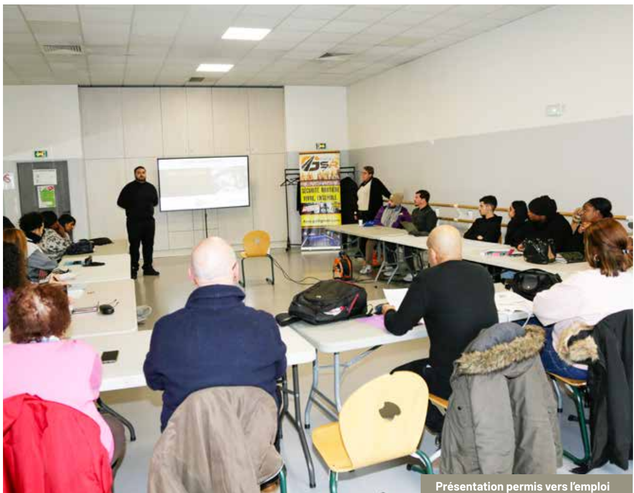
Présentation permis vers l'emploi