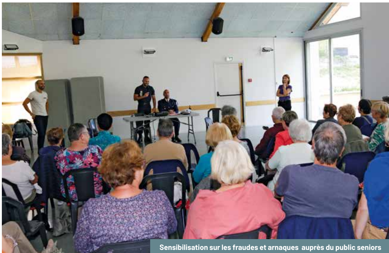
Sensibilisation sur les fraudes et arnaques auprès du public seniors