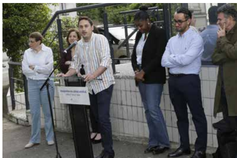
Inauguration du cabinet médical avenue Bernier

171 consultations réalisées (gynécologie, centre de santé sexuelle, protection maternelle et infantile)