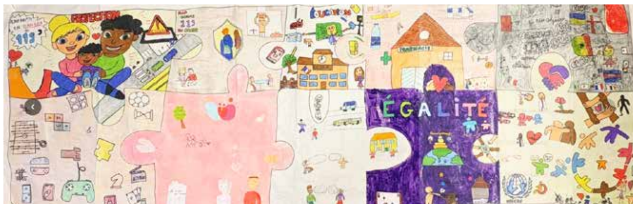
Dessins autour des Droits de l'enfant