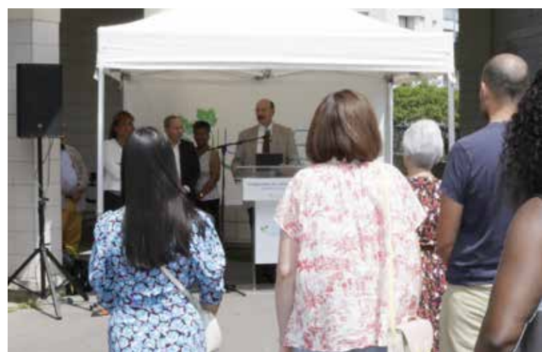
Inauguration du cabinet médical rue Mentienne