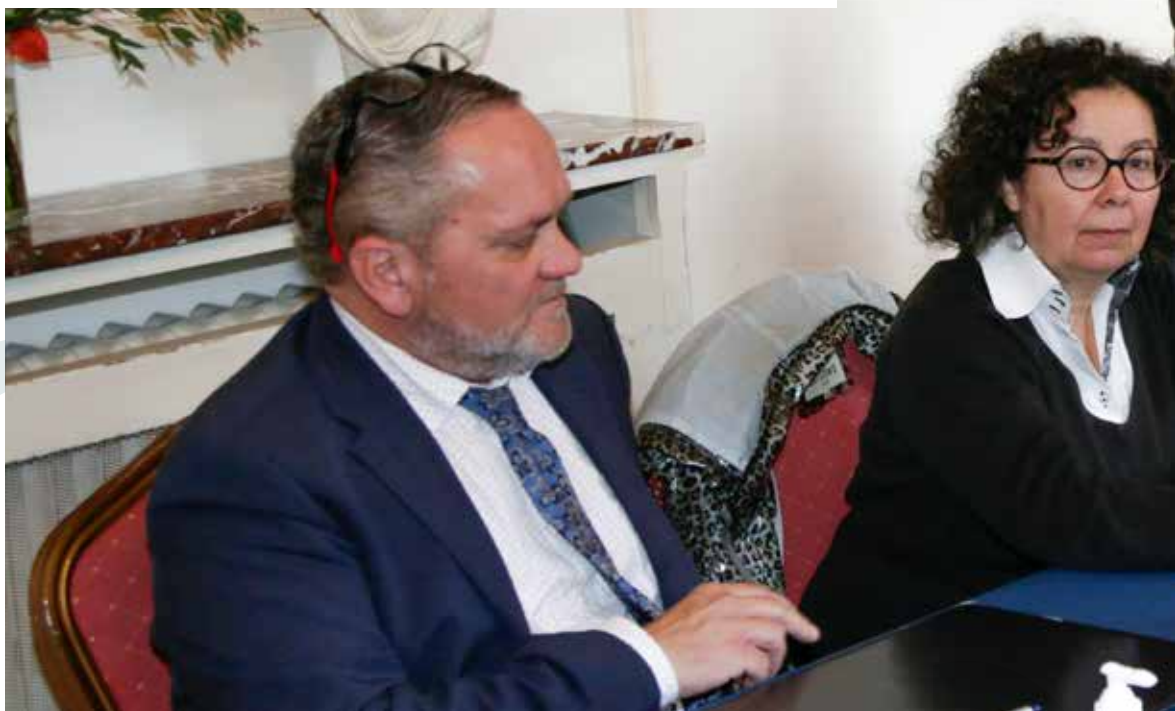
Signature du Contrat Local de Santé