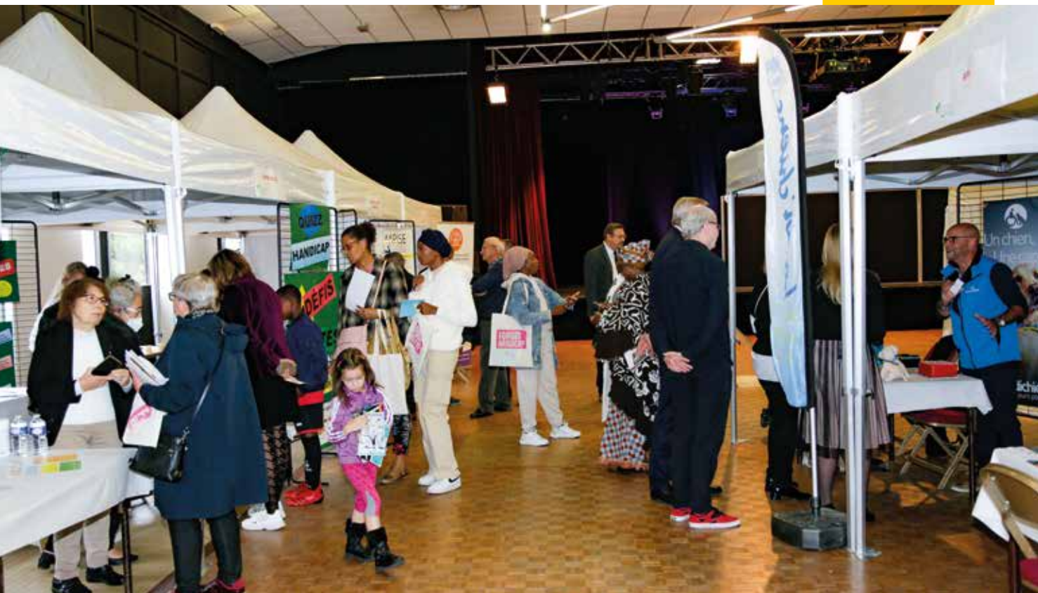
1 er forum intercommunal du handicap en 2022