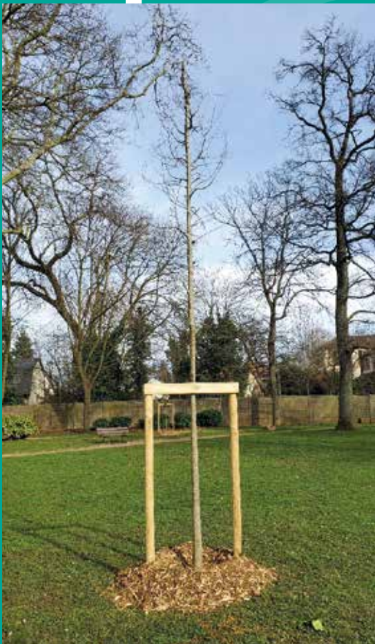
Micocoulier de Provence planté au parc du 11 novembre