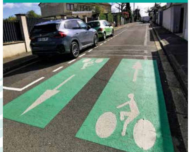
Double sens cyclable avenue du Lac

Né d'une logique de rejoindre à vélo les équipements majeurs, qu'ils soient de détente ou de loisirs (Bois St Martin), sportifs (stades), de transport (Gare RER E) ou scolaires (collège des Prunais et Pierre et Marie Curie) mais aussi d'une nécessité d'apaiser la circulation dans le quartier du Bois de Gaumont, le plan vélo (en partie subventionné par la Région Île-de-France et la Métropole du Grand Paris) aboutira au terme des trois ans de travaux (découpés en trois phases) à un réseau maillé sans discontinuités. La première phase d'aménagements, démarrée en 2023 et s'achevant en 2024, a notamment engendré une modification de la circulation dans le quartier du Bois de Gaumont. Reposant pour l'essentiel sur le principe du partage de la chaussée entre automobilistes et cyclistes et la sécurisation, ces aménagements comprennent notamment un passage en sens unique (en tête bêche) pour les avenues du Lac et des Mousquetaires (cette dernière sera dotée d'un double sens cyclable). Deux autres tronçons sont prévus pour 2024 avec la création de bandes cyclables, de voies vertes (circulation mixte entre vélos et piétons), de doubles sens cyclables, de panneaux directionnels et d'arceaux de stationnement. L'année 2024-2025 verra elle se déployer l'offre sur un axe Nord-Sud depuis le secteur Gare jusqu'aux aménagements existants du chemin des Prunais, en passant par le centre-ville.