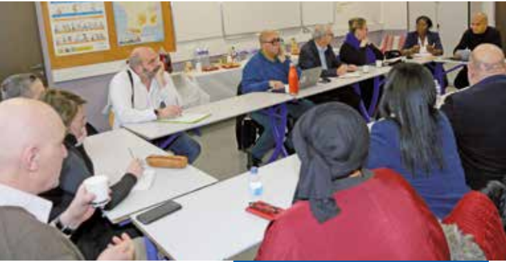
Réunion de lancement du projet