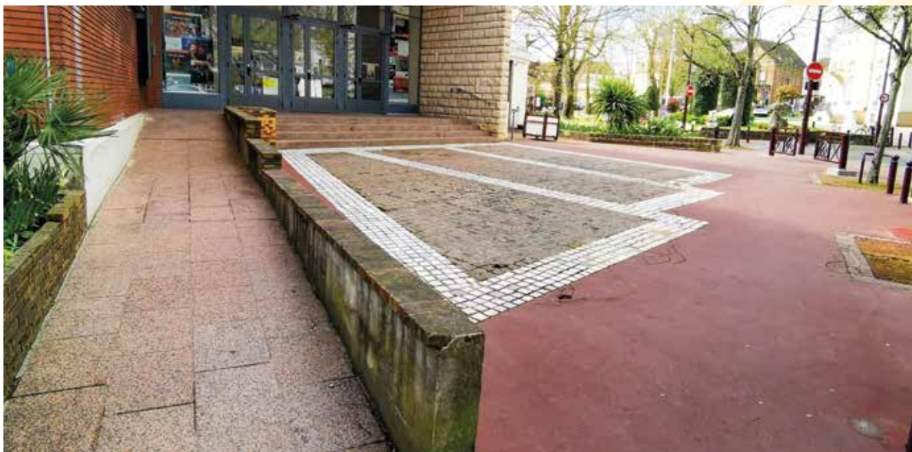
Rampe d'accès à la salle Georges Brassens