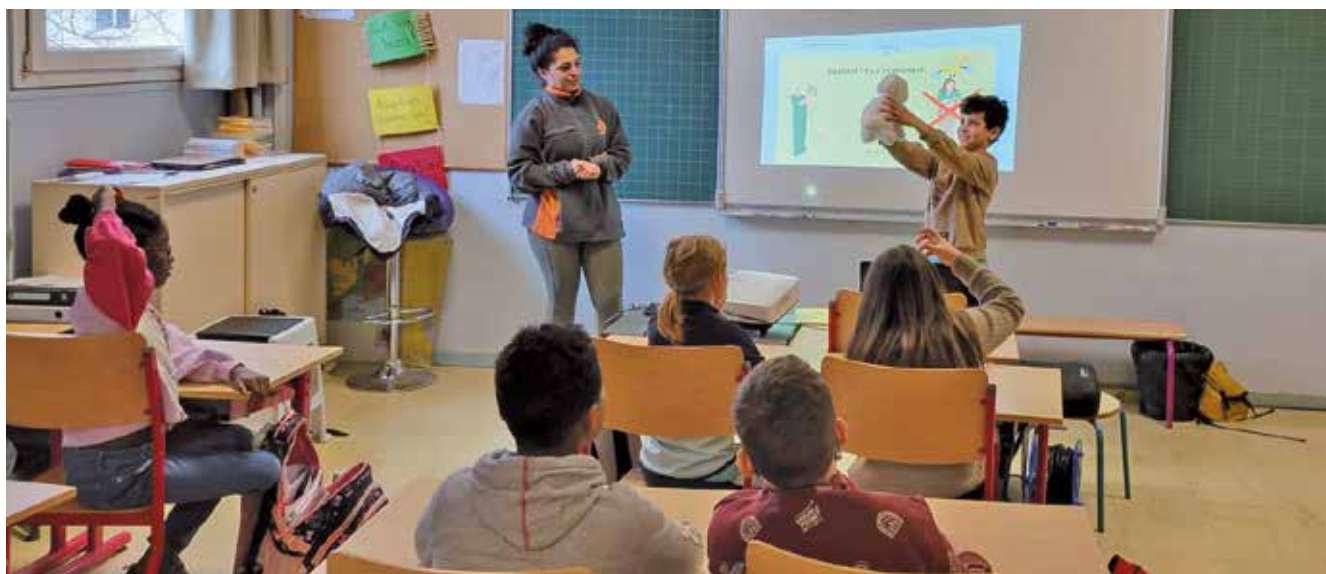
Séance de sensibilisation sur les NACS

Entre les nouveaux ateliers mis en place sur la pause méridienne et la participation à différents projets municipaux (notamment pour le Millénaire) sans oublier les événements habituels, les accueils de loisirs ont eu un début d'année très animé !