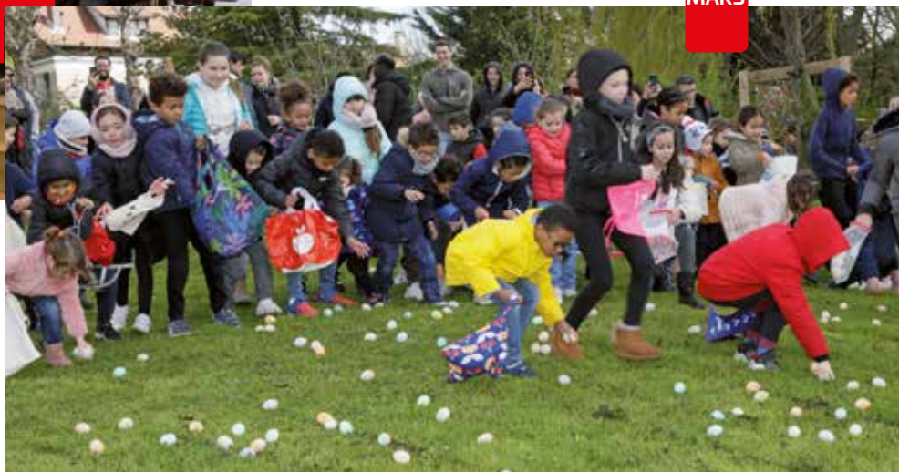
Chasse à l'oeuf 23 MARS