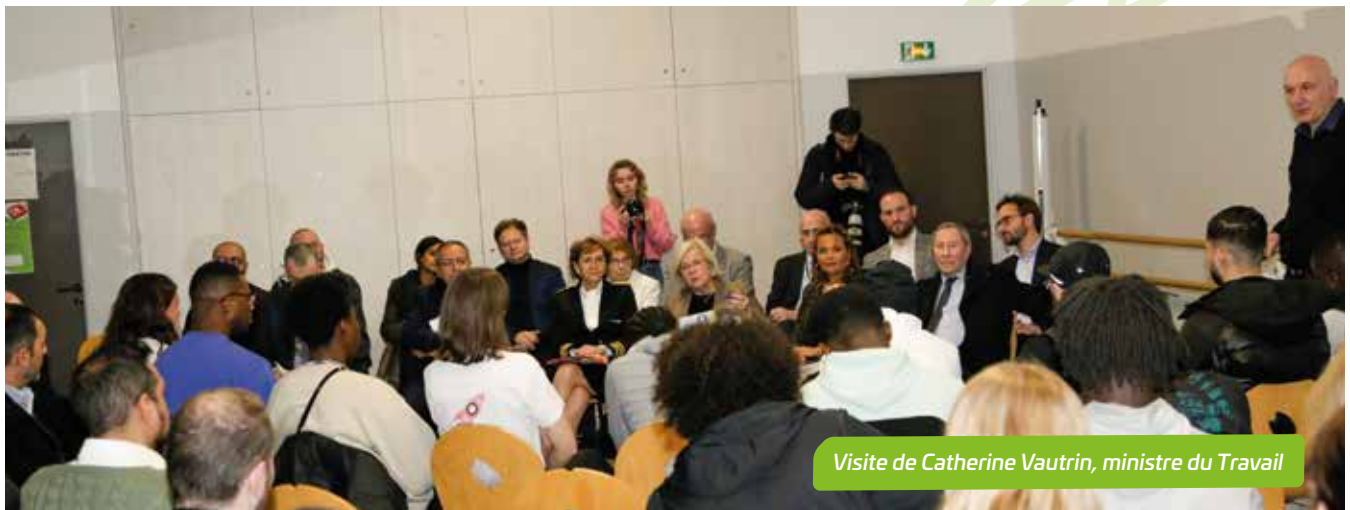
Visite de Catherine Vautrin, ministre du Travail