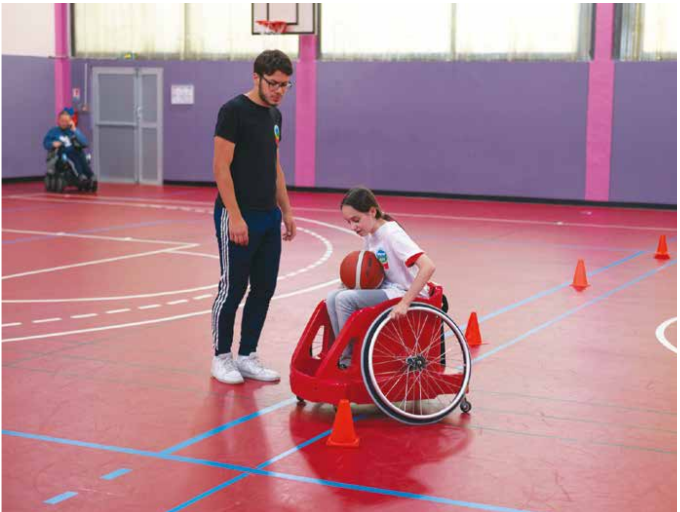
Atelier handisport lors du rallye Educap City

Que ce soit en petite enfance, au niveau périscolaire, auprès du public jeune mais aussi en matière de culture et de sport, le maître-mot à Villiers est ouverture. Cette ouverture passe d'abord par l'accessibilité des services municipaux, condition sine qua non à l'accueil des P.M.R. Au Village de la Petite Enfance, tous les locaux sont aux normes P.M.R. alors que le personnel est lui formé à l'accueil des enfants porteurs de handicap. De son côté, le service périscolaire accueille de nombreux enfants en situation de handicap au sein des accueils de loisirs (37 en 2020, 65 en 2023). En plus d'un protocole d'accueil spécifique, le service a fait l'acquisition du logiciel Boardmaker (financement de la C.A.F.) afin de pouvoir communiquer avec des enfants présentant des troubles autistiques et travaille sur la création d'un espace dédié aux enfants porteurs de handicap. Quant au service Jeunesse, il participe activement chaque année au Téléthon et organise depuis deux ans un rallye citoyen et sportif abordant notamment le handicap.