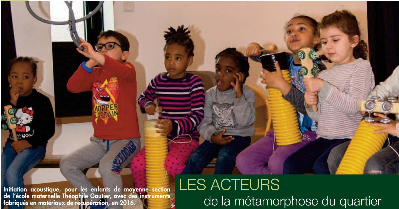
Initiation acoustique, pour les enfants de moyenne section de l'école maternelle Théophile Gautier, avec des instruments fabriqués en matériaux de récupération, en 2016.