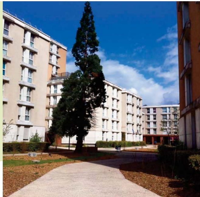
Résidence 2 avec un cœur d'îlot végétalisé ►

Résidence 6 : les travaux de désamiantage sont en cours. L'intérieur et l'accès au bâtiment seront déplacés. Les travaux de la loge groupée Bécaud sont en cours, en attendant les gardiens vous accueillent dans l'ancienne antenne Paris-Habitat au 14 rue Théophile Gautier. La démolition de la terrasse Bécaud, dernier vestige de l'ancienne arcature commerciale, est prévue prochainement.