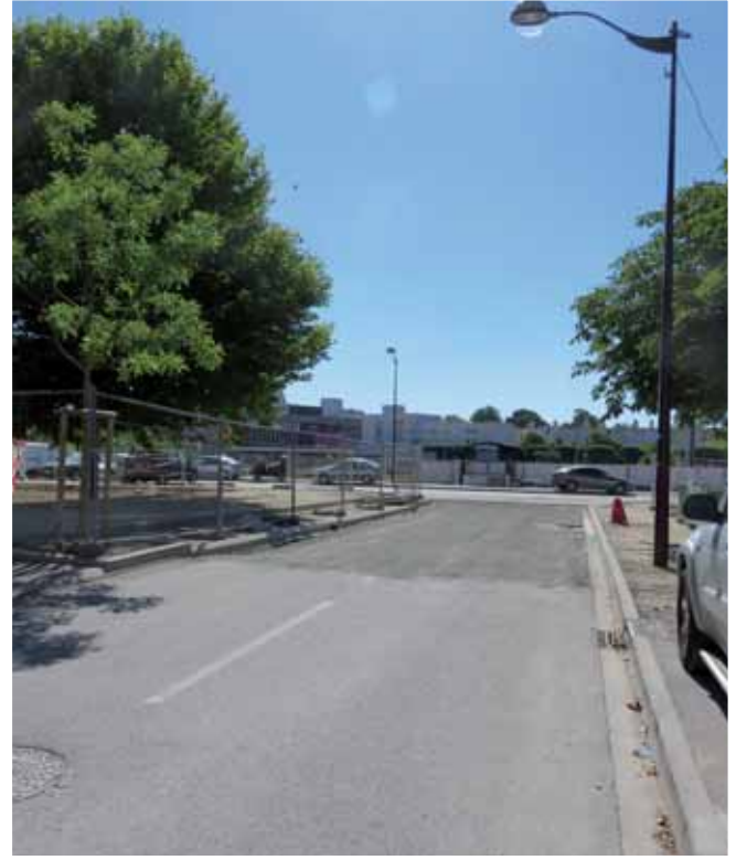
▲ Rue Frédéric Passy.