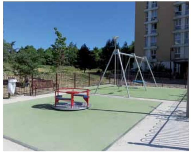
▲ Emplacement de l'ancienne école Péguy.