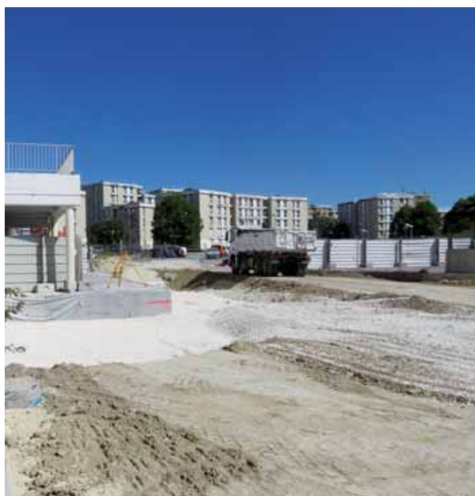
▲ Avenue Nelson Mandela.