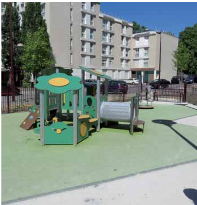
▲ Aux abords de l'ancienne école Mistral.

Le rôle dédié à la ville, dans ce programme de rénovation urbaine du quartier des Hautes-Noues, consistait à réaliser les écoles, les rues et les squares. Malgré les difficultés administratives, techniques, parfois relationnelles avec ses partenaires notamment, la ville a mené à bien tous ses projets, dans le respect des coûts et des calendriers impartis. Ces réalisations contribuent à améliorer votre cadre de vie et celui du quartier.