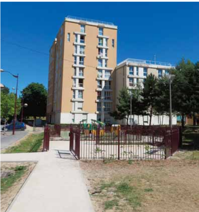
▲ Aux abords de l'ancienne école Mistral.