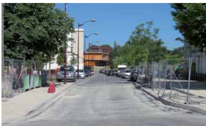
▲ Rue Frédéric Passy.