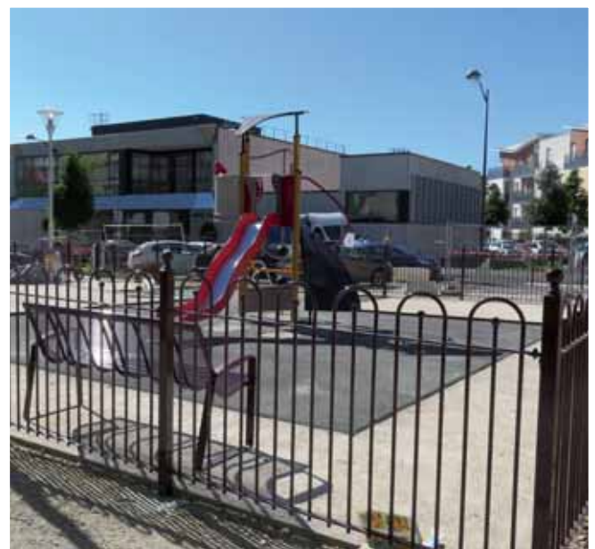
▲ Face à l'école Gautier.