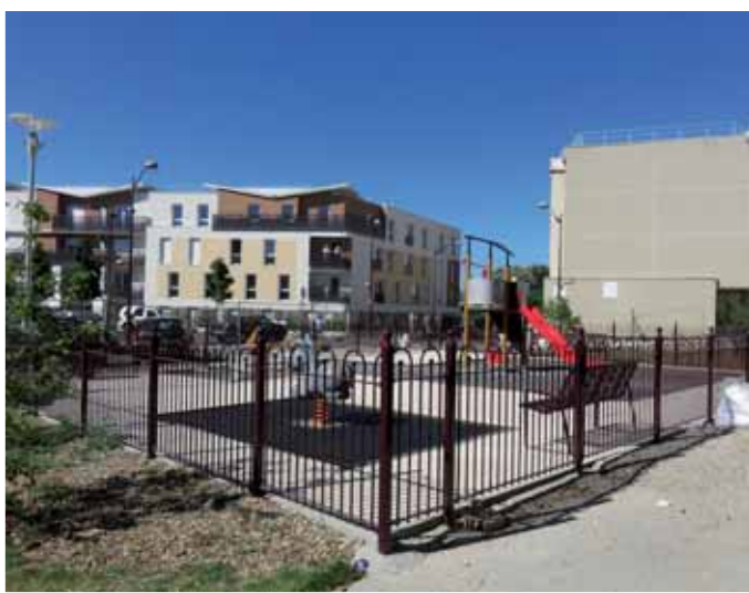
▲ Entre l'école Gautier et le Clos Villiers.