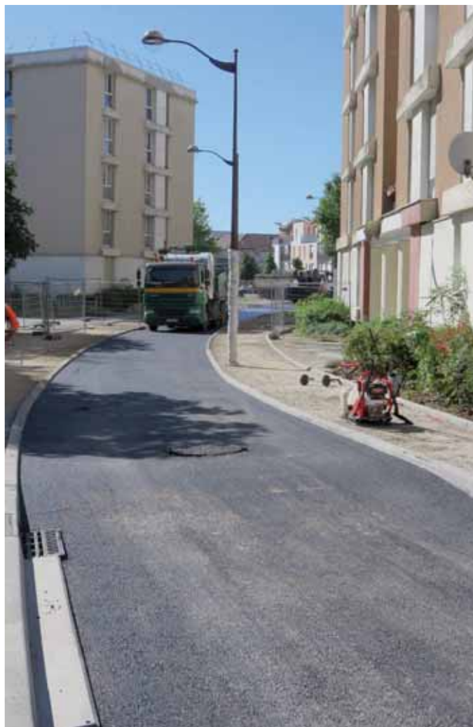
▲ Rue René Cassin.