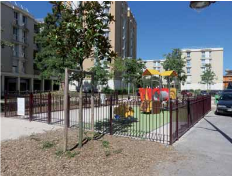
▲ Emplacement de l'ancienne école Péguy.