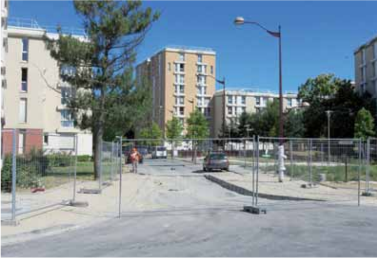
▲ Rue Léon Bourgeois.