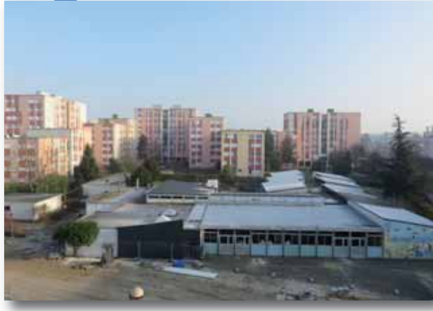
Février 2015 - Travaux de déconstruction de l'ancienne école Camus (partie Est) en cours jusqu'à la mi-mai.