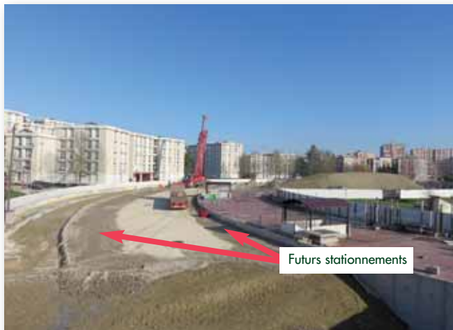
Janvier 2015 - Future avenue Nelson Mandela.