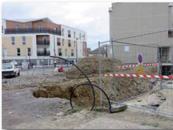
Février 2015 - Démolition de la galerie Valéry pour permettre la création du futur square (SQ2) et le prolongement de la rue René Cassin.