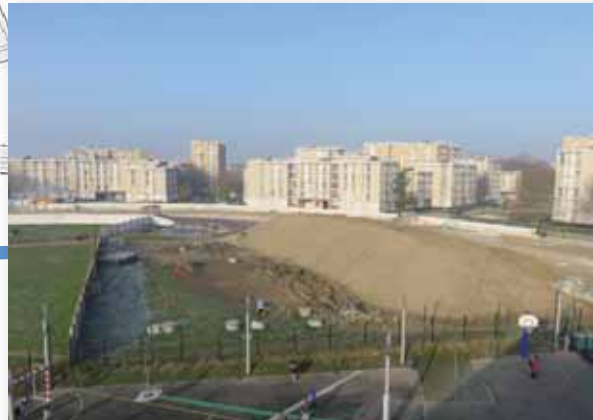
Février 2015 - Stockage de terres pour le remblaiement de la voie camions.