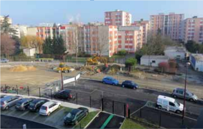
Février 2015 - Amorce de la future avenue Nelson Mandela vue depuis la terrasse de la nouvelle école Camus.