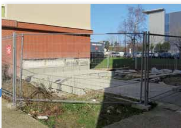
Janvier 2015 - Abaissement de la galerie Mistral pour permettre le passage de la future rue Ferdinand Buisson.