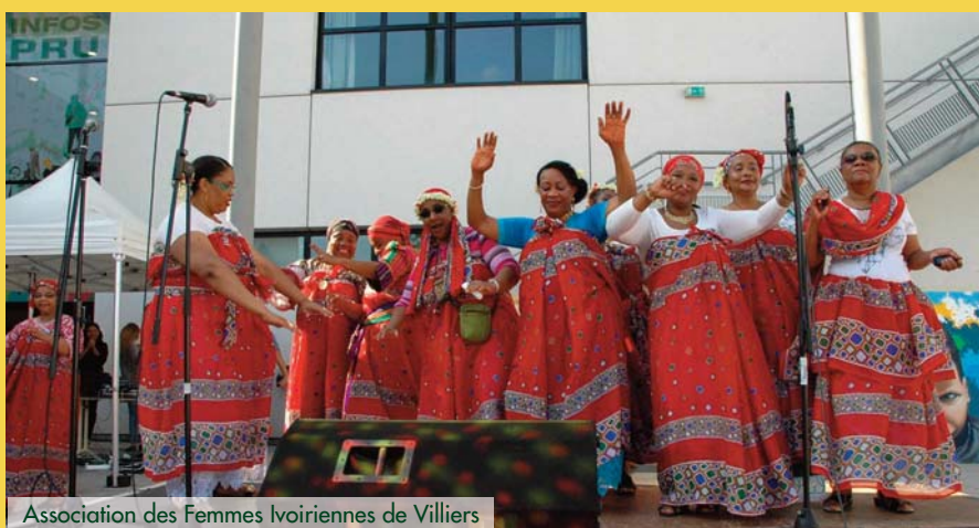
Association des Femmes Ivoiriennes de Villiers