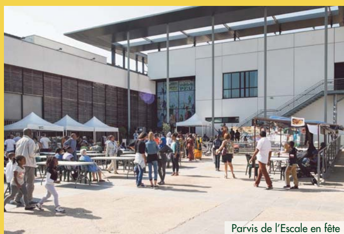
Parvis de l'Escale en fête