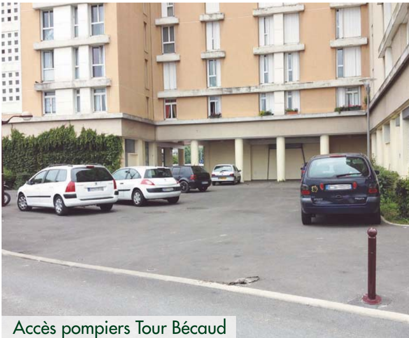
Accès pompiers Tour Bécaud

En attendant la réhabilitation du parking souterrain P6, la création des nouveaux parkings de Paris Habitat et la finalisation des places publiques pour votre sécurité et l'amélioration de votre cadre de vie, voici un rappel de quelques règles de stationnement.