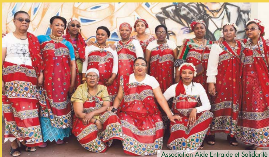
Association Aide Entraide et Solidarité