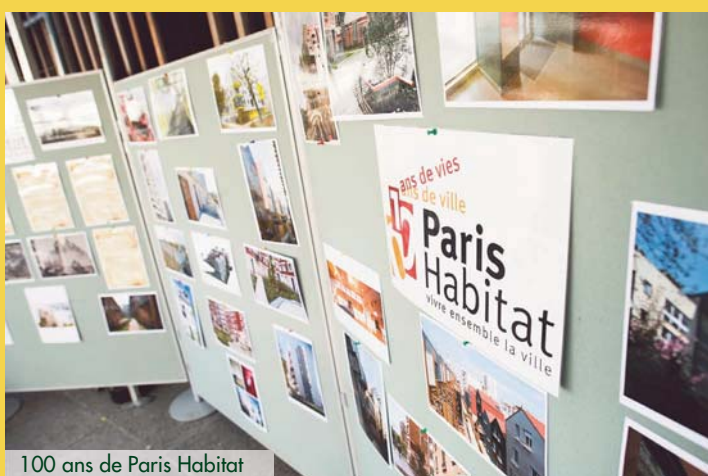
100 ans de Paris Habitat