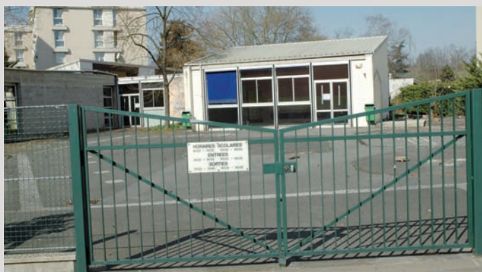
La démolition de l'école Gautier est prévue à partir du 16 avril prochain. Celle de l'école Péguy suivra.