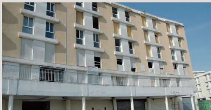
La démolition du bâtiment Bécaud devrait être terminée avant l'été.