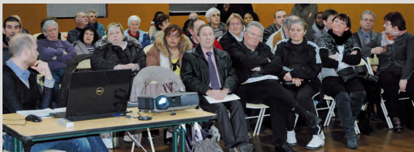
En présence de plusieurs élus, un dialogue s'est instauré avec les habitants du quartier.

Une prochaine réunion publique aura lieu en juin 2012.