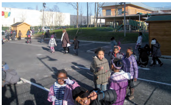
Durant les vacances de Noël 2011, la cour de l'école Péguy a été agrandie de 300 m 2 . Sa surface est désormais de 1150 m 2 , soit 5,45 m 2 par enfant (sur la base de 211 enfants).

Bénéficiant d'un permis de construire délivré le 21 septembre 2011, l'opération le Clos Villiers est le premier programme de nouveaux logements lancé dans le cadre du PRU. Son maître d'ouvrage, la SCI Villiers-chemin des Hautes Noues, a mis au point, avec le concours de l'architecte Laurent Fournet, un bel ensemble immobilier d'une architecture contemporaine et fonctionnelle. Il vise à répondre à la fois aux besoins de résidents actuels des Hautes-Noues, désireux d'accéder à la propriété dans ce quartier auquel ils sont attachés et à ceux de nouveaux venus, de Villiers et d'ailleurs, attirés par l'évolution de l'image du quartier et les nouveaux services résultant de la rénovation générale du PRU. Située chemin des Hautes Noues, à l'entrée ouest du quartier, cette résidence sera composée de 83 appartements, du deux au cinq pièces, avec des jardins privatifs en rez-de-chaussée et des balcons en étage. Elle bénéficie de la nouvelle norme BBC (Bâtiment à Basse Consommation), de l'accès aux prêts à taux zéro et de la TVA au taux réduit de 7%, s'agissant d'une opération