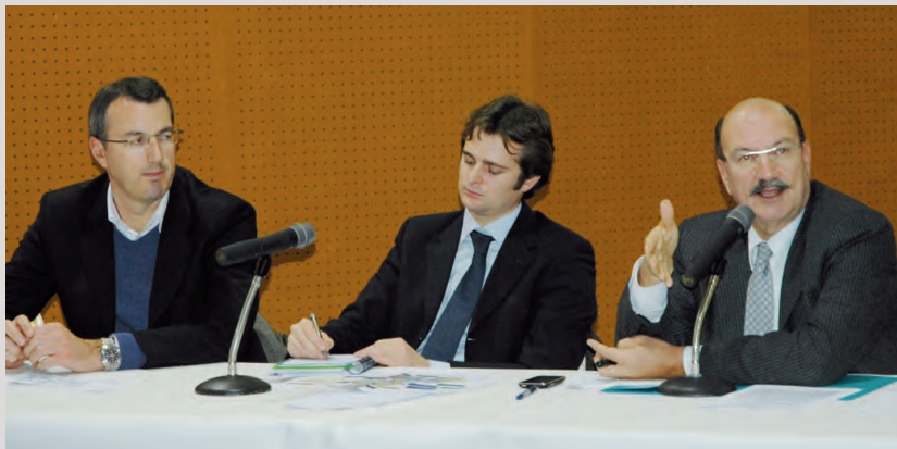
Le Maire et les représentants de la SAHN ont présenté l'avancée des travaux et les projets.

Le 12 décembre 2011, à 19h à l'Escale, Monsieur le Maire a présenté en réunion publique l'avancement du PRU des Hautes Noues aux habitants du quartier. En effet, suite au passage en Comité National d'Engagement, la Ville et ses partenaires associés, (la SAHN et Paris Habitat), ont bénéficié d'un avenant important actant le démarrage opérationnel d'une deuxième tranche de travaux et validant, entre autres, le nouveau schéma de stationnement automobile.