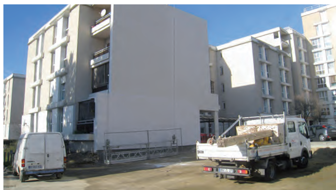
Le bâtiment Paul Valéry restant à pignon sur la future rue des Naïades.