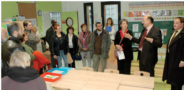
Habitants et parents d'élèves durant la visite de l'école Péguy, le 3 décembre dernier.