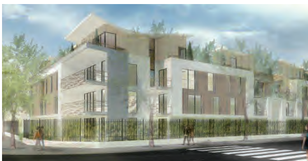
L'esquisse prévisionnelle du Clos Villiers.