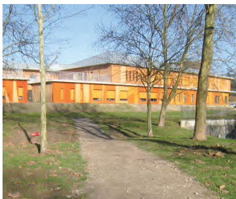
La voie piétonne reliant l'école Péguy à l'allée des Naïdes.

Fin 2011 ont été réalisés la pose du nouvel abribus et le cheminement piéton reliant la nouvelle école Péguy aux résidences voisines. La reprise des revêtements de chaussée visant à améliorer le ralentissement des automobiles a été aussi conduite en début d'année. Le 10 février, les dernières plantations d'arbres et des poses de candélabres achèveront la spectaculaire modernisation de ce tronçon du boulevard Bishop's Stortford.