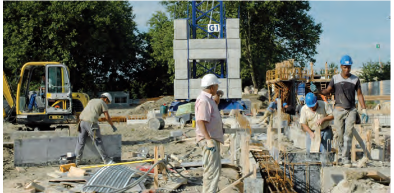
Le chantier de l'école Charles Péguy.