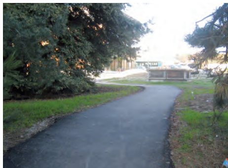
Le cheminement piéton reliant le cœur du quartier à l'école Péguy.

Après la phase de curage menée fin 2011 par l'entreprise Terdem Environnement, l'opération de désamiantage a repris à la mi-janvier. La SAHN rappelle que, pendant cette période délicate, toutes dispositions sont prises pour garantir la sécurité des habitations riveraines des écoles. Elle invite les familles à rester néanmoins vigilantes sur les circulations des enfants et le strict respect des panneaux d'information et d'interdiction posés par l'entreprise. A la suite des désamiantages, la phase finale de démolition pourra s'engager en vue d'un achèvement vers la fin avril.