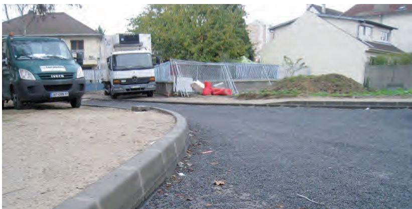
La future route Bécaud, angle route de Bry

La SCREG a terminé l'essentiel des travaux de la phase I, relatifs à la desserte de la nouvelle école Péguy (ouverte début septembre) et à la restructuration du premier tronçon du boulevard Bishop's Stortford. Des éléments de mobilier urbain (bancs, candélabres,...) doivent encore être installés.