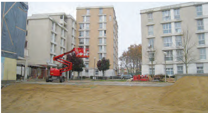
Emplacement de la future voie des Naïades