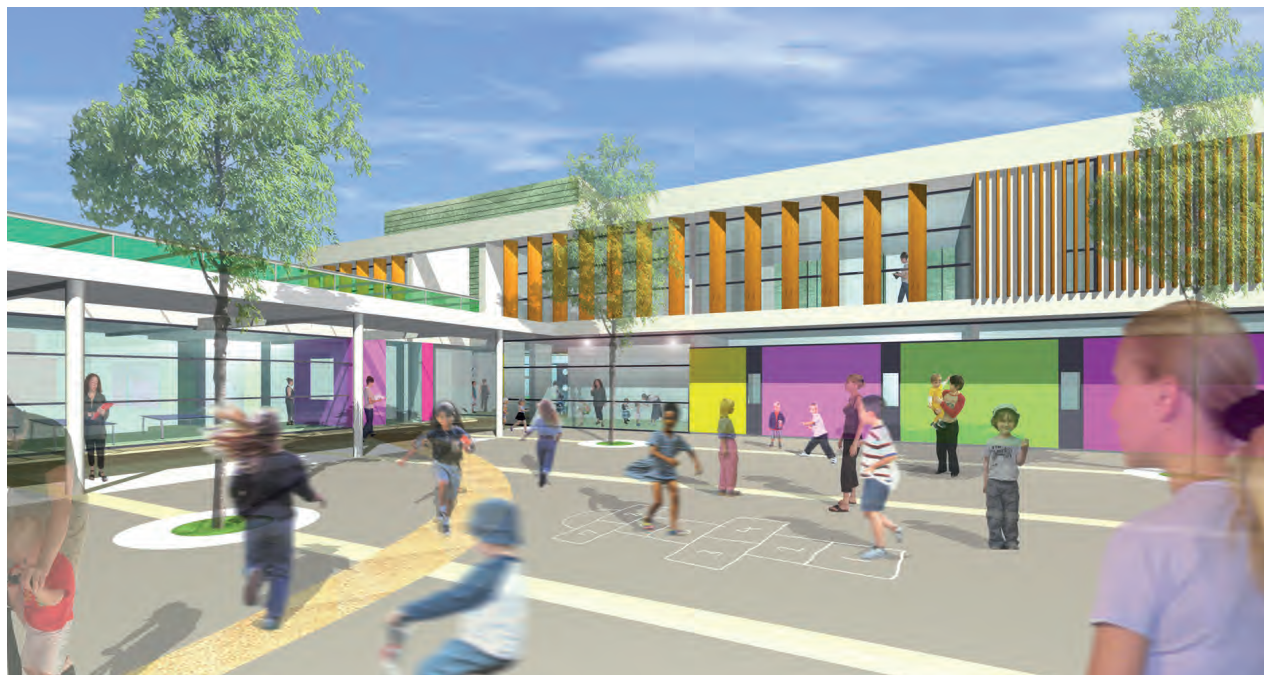
La nouvelle école maternelle Théophile Gautier, vue de la cour de récréation.